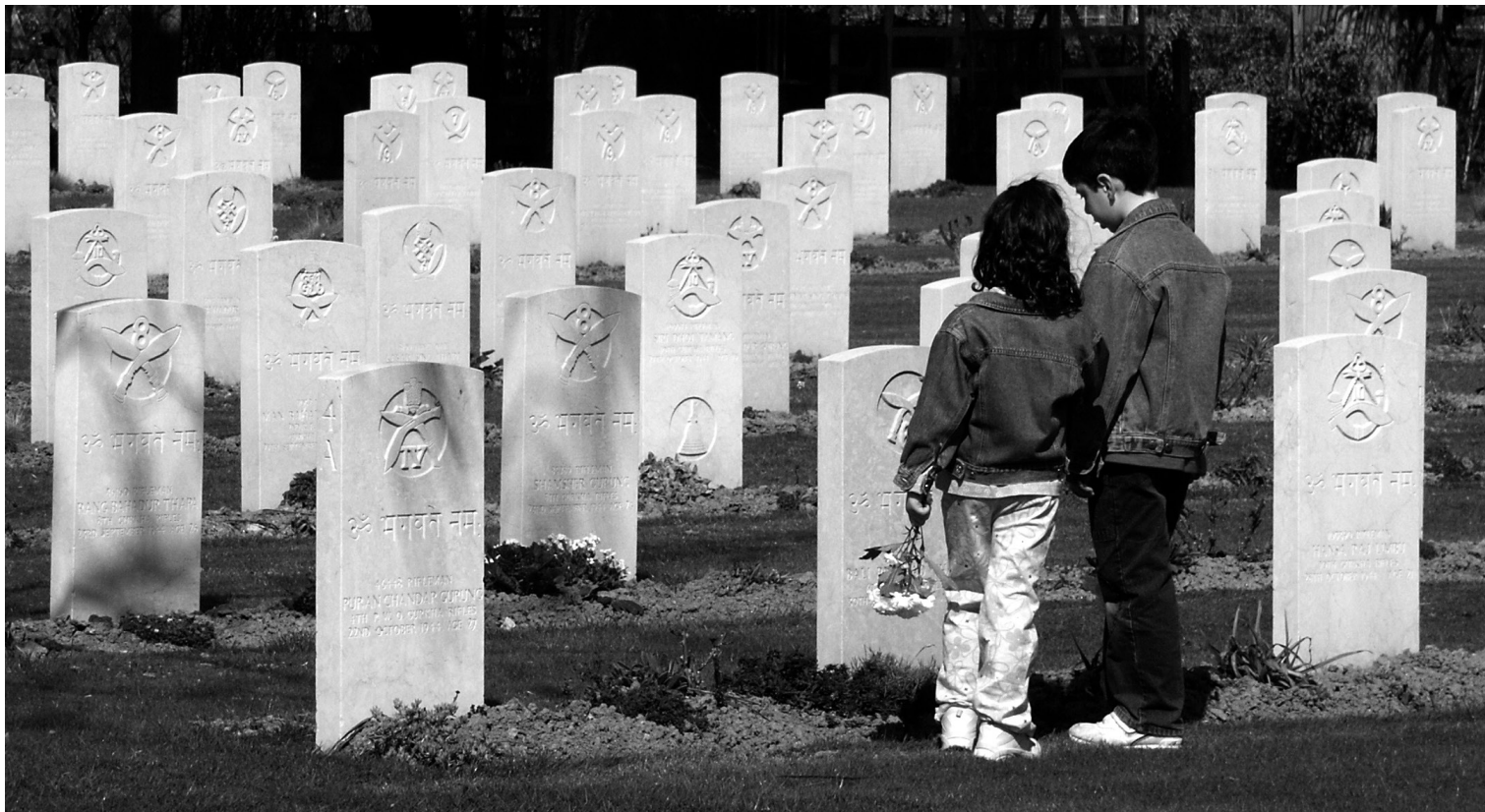
Rimini, Cimitero di guerra del Commonwealth, strada consolare Rimini-S. Marino